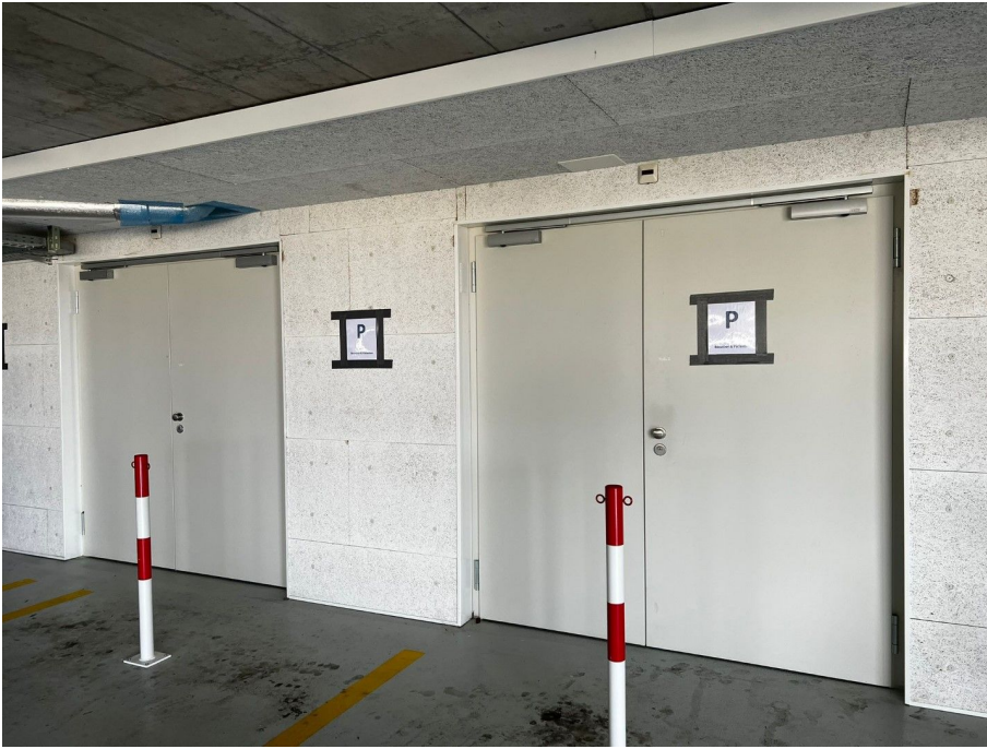
STU / STS 30-2 OD Brandschutztüren