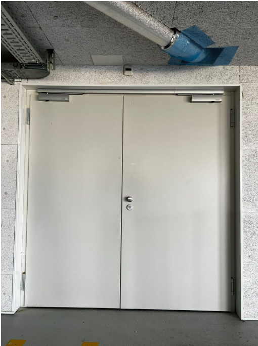
STU / STS 30-2 OD Brandschutztüre